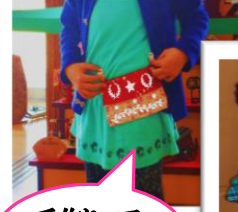
手作りって、 楽しいね！