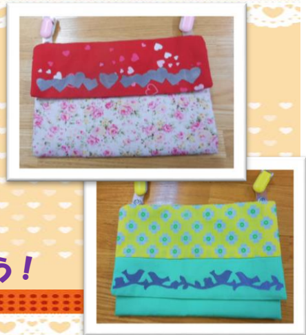
(イメージ写真です。)

反射材付きで、交通安全もバッチリ！ 世界に一つだけのオリジナルのキッズポケットを作ろう！