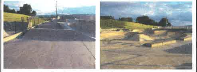
スケートパークのイメージ（写真は最上川ふるさと総合公園）