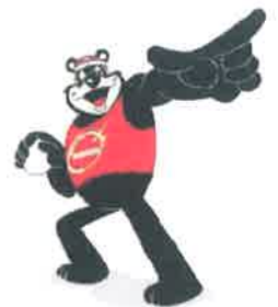
昭和新山国際雪合戦マスコットキャラクターブラッキー