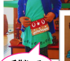
手作りって、 楽しいね！